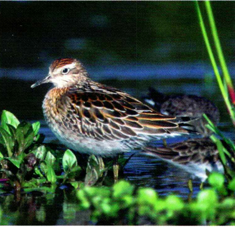
Sharp-tailed Sandpiper - Calidris acuminata

As a subscriber to the E-mail list serve, fws-shorebirds, you will receive mail from other shorebird pen pals around the world and have the opportunity to send messages back. List serve subscribers participate from throughout the world and are from diverse backgrounds. For example, biologists contribute data from their field research, schools send postings from their shorebird/wetland field trips, environmental educators share activities/programs, shorebird enthusiasts add migration observations, and managers distribute information about conservation efforts for shorebirds. As a subscriber to the fws-shorebirds list serve, you can ask questions of participants, contribute data, share information about your programs, or follow the migration of shorebirds. To subscribe to the list serve, send an E-mail message to heather_johnson@fws.gov .