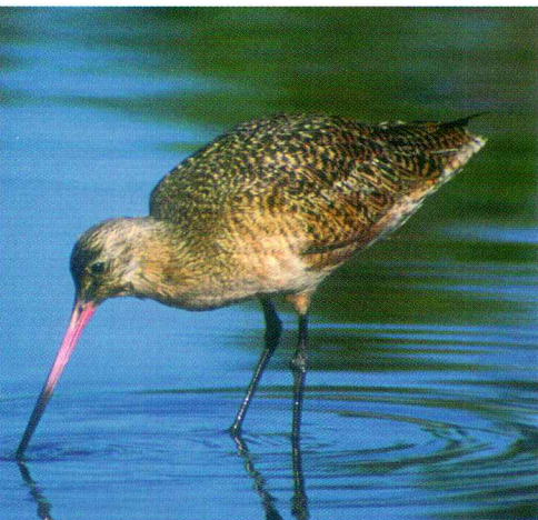
Marbled Godwit - Limosa fedoa

Participation can include subscribing to the E-mail list serve, viewing the World Wide Web site, or completing activities from the educational curriculum Arctic-Nesting Shorebirds.