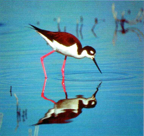
Black-necked Stilt - Himantopus mexicanus