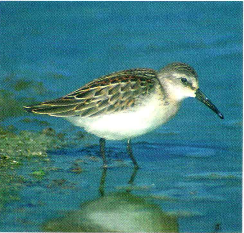
Western Sandpiper - Calidris mauri