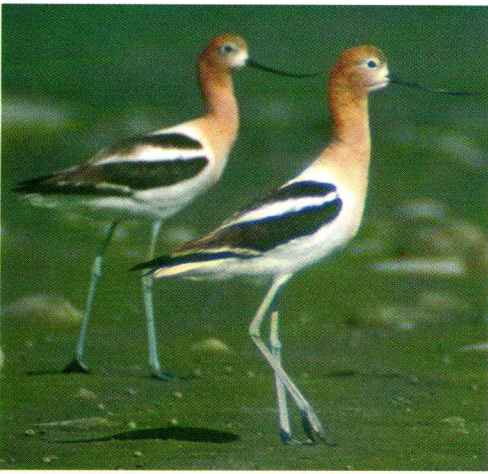
American Avocet - Recurvirostra americana

Hilary Chapman U.S. Fish and Wildlife Service Route 1 Box 166 MS-18 Shepherdstown, WV 25443-9713 304/876-7783 (telephone) 304/876-7231 (fax) hilary_chapman@fws.gov