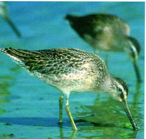
Short-billed Dowitcher - Limnodromus griseus